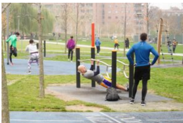
AVVISO PUBBLICO SPORT NEI PARCHI

Avviso Pubblico per l’adesione di Associazioni / Società sportive dilettantistiche al progetto “Sport nei Parchi” - Linea di intervento 2 - Urban sport activity e weekend .